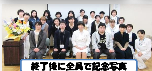
終了後に全員で記念写真

参加して下さった学生さん、1日お疲れさまでした。セミナーで学んだことを、実習で活かして下さいね。